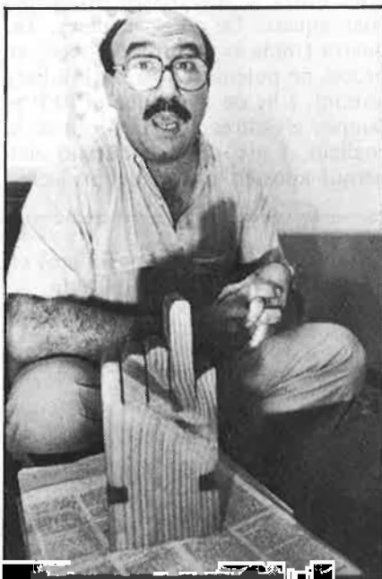
«Una esquerra que faça una oposició seriosa».

—La nostra posició és molt clara: paralizació fins que s'estudie que