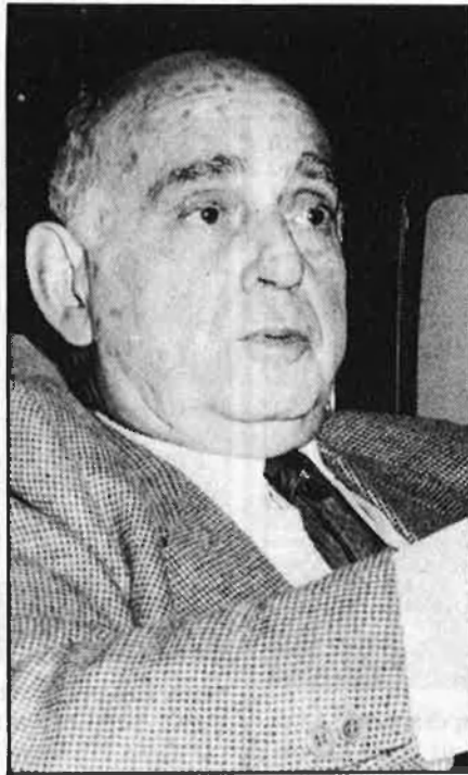
«Tinc complex per tenir una afecció com aquesta».

—Sí, sí. Va ser impressionant. Tot l'estadi del Sevilla era una immensa bandera blau-grana i una immensa