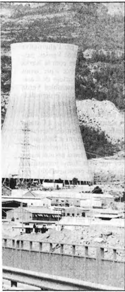
Central nuclear de Cofrents. A la dreta, manifestació a València, després de l'accident de Txernívtsi i pancarta de Greenpeace al Micalet.

mes de coordinació a nivell estatal: la Coordinadora para la Defensa de las Aves (CODA). Una altra entitat de llarga trajectòria és la Colla Ecologista de Castelló, bastant activa a les comarques del nord del País Valencià. Després, per donar testimoni de la vitalitat i la pluralitat del moviment, es poden comptabilitzar un bon nombre de grups de caràcter local com Rosella, a Torrent; la Carrasca, a Alcoi; el grup ecologista Montgó, a Dènia; el grup ecologista Samaruc d'Oliva i altres grups de la Safor, la Vall d'Uixó, Borriana, Bétera... El CEAMA (Centre d'Estudis i Activitats del Medi Ambient), amb seu a València, és un grup integrat per tècnics, biòlegs i