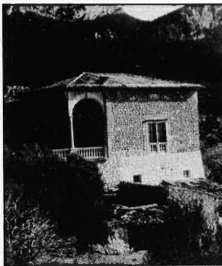
Son Marroig, propietat de l'Arxiduc.