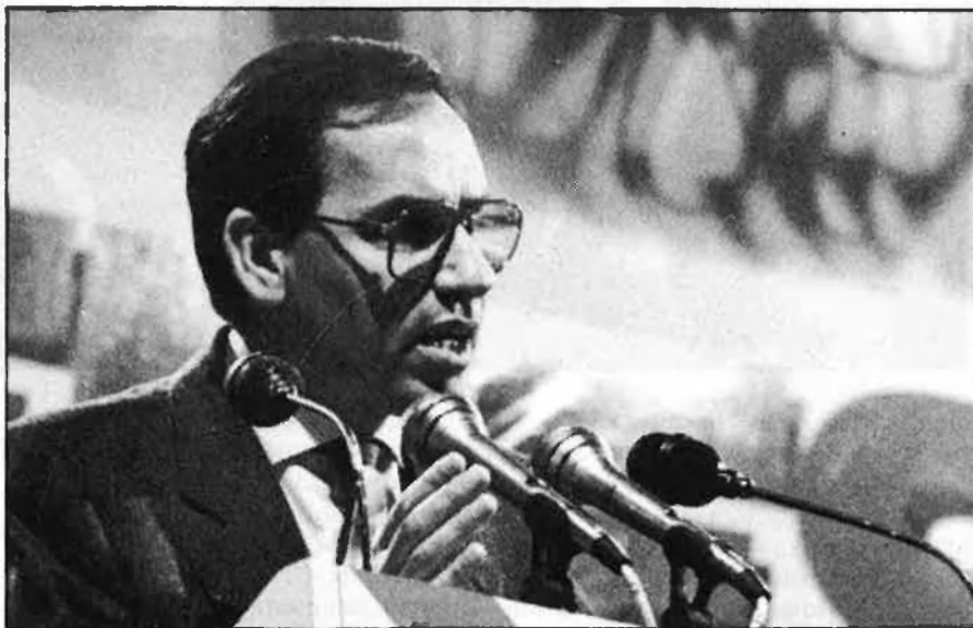
El «mètode Guerra», ben expeditiu.

Hi ha formacions que semblen tenir un valor especial. Set partits d'una implantació electoral dubtosa s'han coaligat en la plataforma Izquierda Unida i, després, es posen a parlar de les llistes, almenys segons la versió oficial. Si és difícil posar d'acord els militants d'un sol partit, només cal imaginar les baralles per compaginar els interessos de set militàncies, més alguns independents de categoria. D'altres vegades, el problema és la manca de gent: El CDS anuncià com un gran triomf que presentarà candidats al Congrés i al Senat «en totes les províncies».