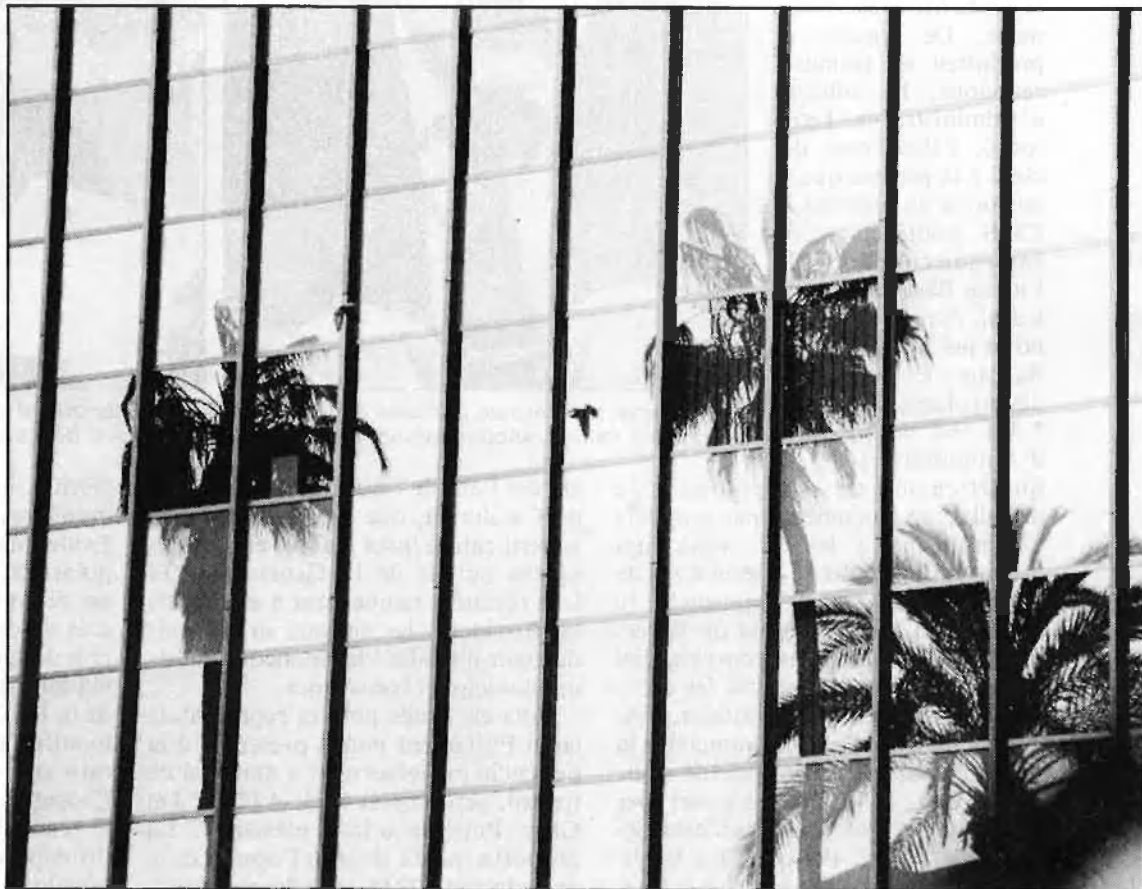
Menyspreada per Espanya, menyspreada pels catalans, Barcelona viu en l'esquizofrènia.