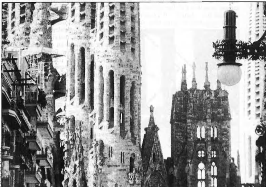
Barcelona —diuen— ja no és líder de res.

Berlín és un exemple clar que les ciutats se senten contentes i orgulloses d'elles mateixes només quan són líders d'alguna cosa, país, idea o proposta. El Berlín que era la indiscutible capital d'Alemanya i de l'Euro-