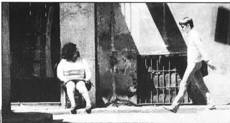
Tots els camins duen al carrer de l'Hospital...

dar, hi anàvem a comprovar les suficiències sexuals, actes de reafirmació per als quals eren imprescindibles eines que el migrat desenvolupament industrial posava a l'abast dels «gigolos». Un granet de café introduït a la boca, segons l'erotisme didàctic d'aleshores, estirava una estona més el plaer. Mecanisme tan rudimentari i antiestètic —la llengua i la boca adquirien una tonalitat quasi obscura i no exempta de patetisme— no aconseguien el resultat que s'esperava. Tanmateix, era esperançador ratificar la infinita tolerància de la fulana, de la qual mai no vaig saber el nom. Tant se val, al capdavant també ella restarà com un personatge incrustat en la memòria urbana. Eterna.