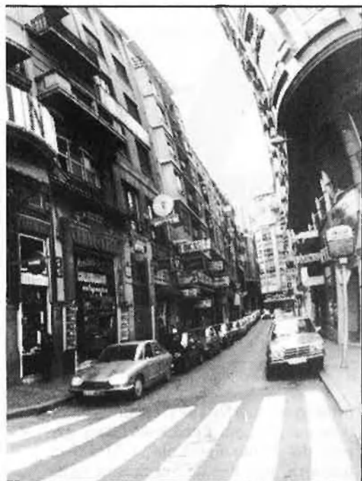
Fruita prohibida i desitjable.

que fos per una estona, el buen camino . Potser és una obsessió col·lectiva que compartim un grapat de gent de la collita dels cinquanta, però aleshores, i sovint ara, tots els camins porten al carrer de l'Hospital de València.