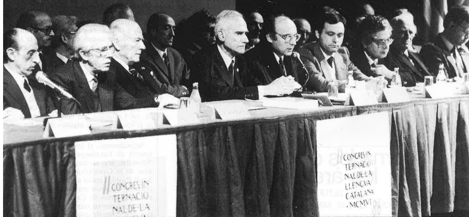
INAUGURACIÓ DEL II CONGRES INTERNACIONAL DE LA LENGUA CATALANA