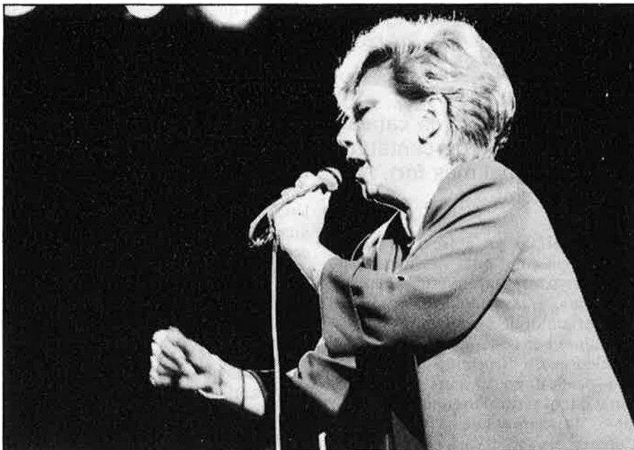
«BOLOS» ESTIUENCS, A UN PAS