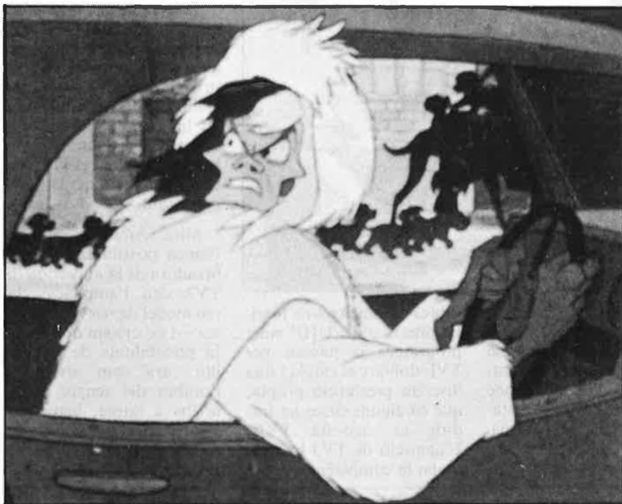
A l'esquerra, dalt, Campaneta, una fada sexy i independent; baix, la reina Grimilda, entre Lady Macbeth i «femme fatale». A la dreta, dalt, Cruella de Vil, diabòlica i sofisticada; baix, Malèfica i La Bella Dorment.

Amb tot, li cap l'honor d'haver servit com a model estètic a figures tan significatives en els anys vuitanta com Grace Jones o la mexicana Alaska. □