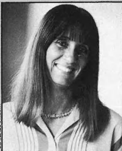
DO MENEZ UMBER

Mentre a Gran Bretanya la pública BBC coexisteix amb una TV a qui no agrada de dir-se privada, sinó independent, amb una estructura federal (la ITV està formada per 15 societats de TV de base regional independents per produir o adquirir, regulades per l'IBA, organisme de denominació governamental, però apolític, i un canal d'àmbit estatal), a Itàlia trobem més dues-centes televisions que funcionen en un sistema de lliure mercat, competint amb la RAI. A França, després de deu anys de discussió, des de fa sis mesos funcionen dos canals que conviuen amb els tres públics (dos estatals i un regional) i