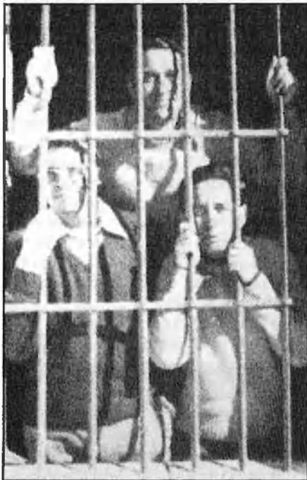
A l'esquerra, la portada dedicada a la incipient conspiració colpista. Dalt, militars de la UMD en presó.

De la naturalesa dels escrits, però, es pot deduir que el perill no és, de moment, tan real i que es tracta d'un moviment típic en altres països de l'OTAN, especialment Itàlia, on les incitacions escrites i epistolars a la rebel·lió semblen haver entrat pràcticament en el terreny del costum. El grup de coronels, capitans, tinents o comandants amagats darrere el pseudònim d'«El Director» (el mateix que usà el general Mola abans de la insurrecció franquista) sembla que no ha passat d'un estadi de pura i simple publicitat, i captació de possibles adherents. Una fase de la qual podrien no eixir mai i que es limitaria a accions