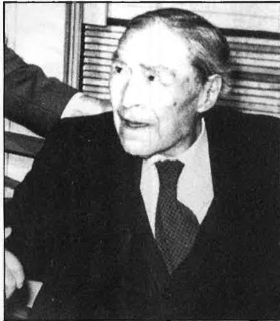
«Si el senyor Pla va ser espia de Franco, no comprenc com el 'Caudillo' guanyà la guerra.»

castellà per guanyar-nos els cigrons. I, en això, no s'hi valen bromes. A l'hora de la veritat, a les Obres Completes, però, el senyor Pla ha deixat tot allò salvable en català, els agrada o no.