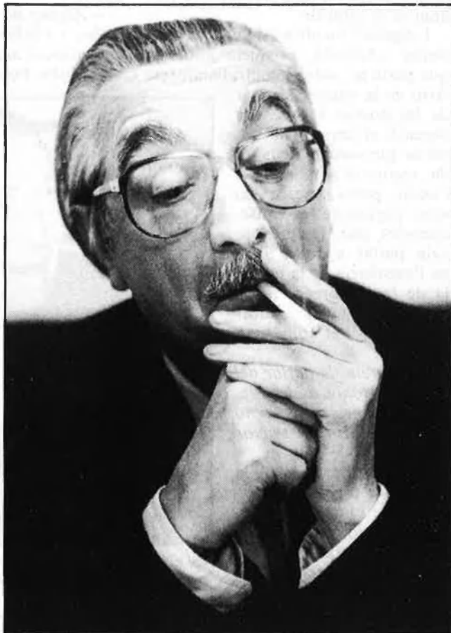
«Deies València, i el tenies fent-te costat».

XVI. A més, aquesta és una passió que crec compartir amb el senyor Pla, entre d'altres. Tant per afinitat ideològica, com per proximitat lingüística, sempre m'he sentit molt a prop de tota aquella fauna de moralistes, llibertins i il·lustrats. De Montaigne, el primer, a Sade; de Diderot a La Bruyère... si mires per la biblioteca, trobaràs unes quantes edicions de cadascun d'ells, no caldria sinó. ¡Bona companyia, els racionalistes!