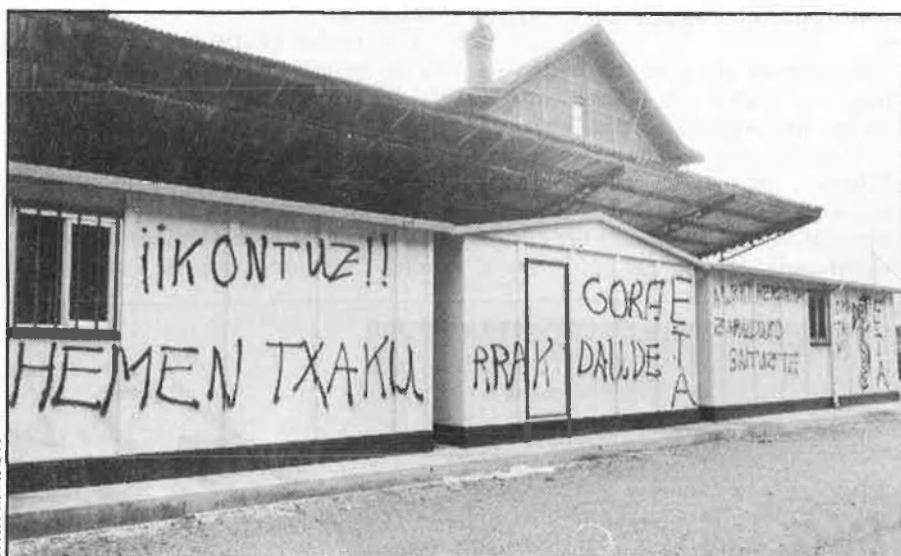
L'origen de la violència a Euskadi és nacionalista, diu l'Informe.

El partit de Juan Maria Bandrés, Euskadiko Eskerra, reaccionà sobre l'informe en termes fonamentalment