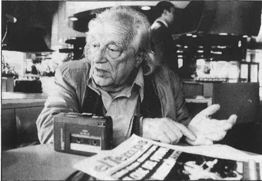
Ací mateix, a València, bombardejaven el port quasi cada nit.