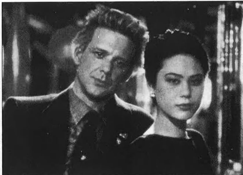
A l'esquerra, Christopher Lambert. A la dreta, Sam Shepard, Mickey Rourke i William Hurt.

El seu Tarzan serà acollit molt favorablement per la crítica mundial. Aquest enfant du siècle porta camí de convertir-se en l'estrella internacional que la cinematografia francesa no coneix des dels bons temps dels Belmondo i Delon. El seu darrer film, Highlander , així pareix confirmar-ho. Un