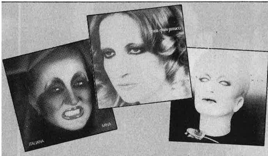
Una presència només plasmada en les cobertes dels seus discs.