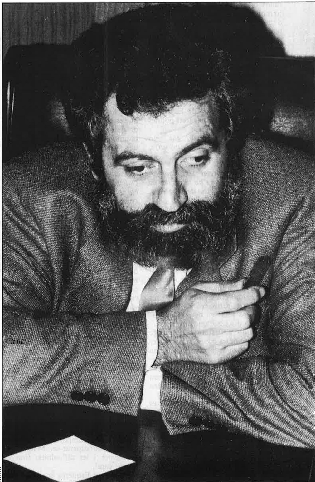
«Els continguts de l'antic PSPV encara són vius».

—Ets un personatge atípic, si et comparem amb molts militants del socialisme valencià actual, amb molta