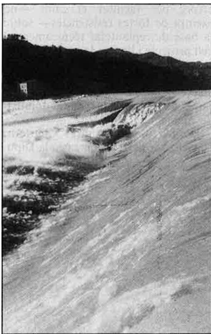
«Uns recursos excedentaris?»

El 26 de juny de 1984, les Corts valencianes aprovaven per unanimitat, a proposta del Grup Popular, una proposició no de llei que instava el Consell de la Generalitat a «recaptar del govern de la nació l'acabament de les obres del Canal de l'Ebre, tram Xerta-Càlig, i l'entrada en funcionament, d'acord amb les comunitats autònomes afectades».