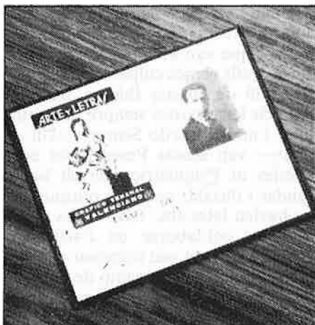
Carnet de redactor de la revista valenciana «Arte i letras».

Tot va començar quan ell comentà a un amic que l'home que anaven a jutjar a Israel pels seus crims nazis,