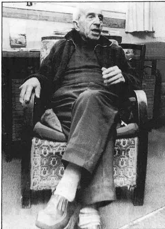
«Tota la vida he estat predestinat a morir».