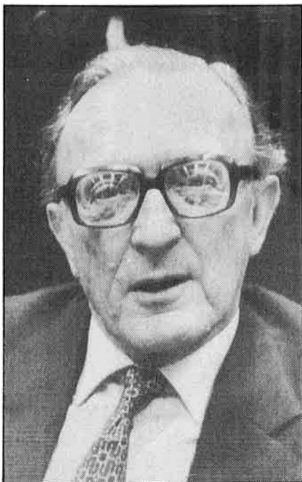
Per a lord Carrington, Espanya haurà d'assumir funcions reservades fins ara als Estats Units.

Per al també socialista Bettino Craxi, «la imatge democràtica de la nova Espanya ha quedat sensiblement reforçada». Només els socialistes grecs del PASOK mantenien silenci sobre els resultats, tot i que el partit EDA, una mena de PSP a la grega, satèl·lit del partit de Papandreu, afirmava que al seu país el resultat hauria estat completament distint. Tots els ministres de Defensa dels països membres de l'OTAN, finalment, telefonaren al