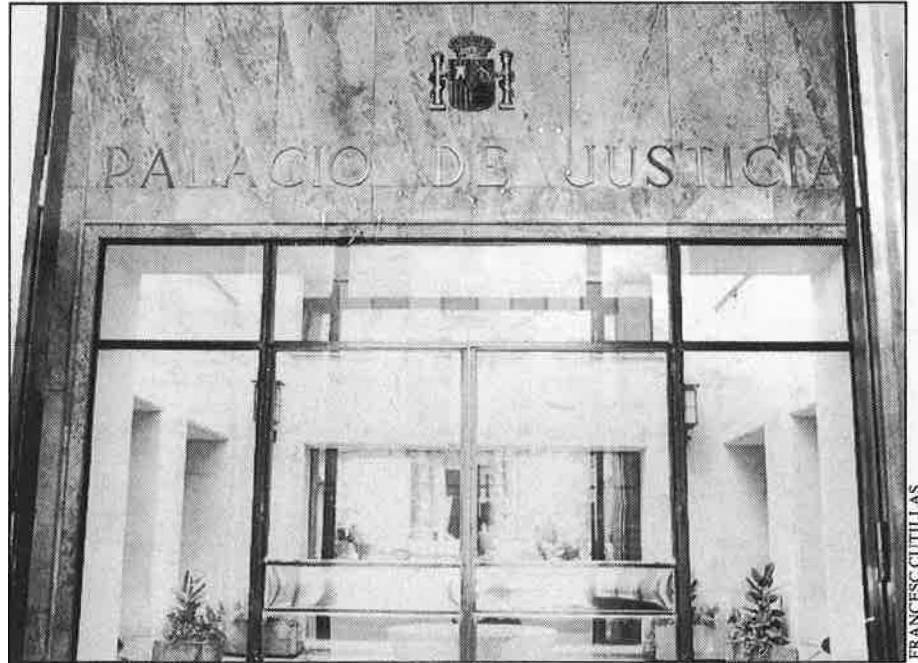
Palau de Justícia: el rumor continu.

suborn no li passàs res, i un mitjà per arribar a això seria l'aplicació de l'article 390 del Codi Penal, que fa responsable de suborn aquell funcionari que demana diners per tal de dur a cap un acte just que no ha de ser retribuït, i no aquell que dona els diners, que no té per què saber que no cal entregar tals diners; així, seria molt més fàcil que advocats i procuradors denunciassen aquestes situacions».