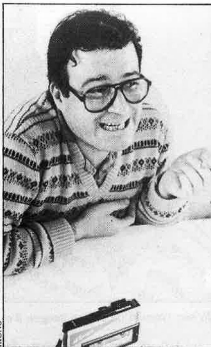
«La gent m'interessa menys que les pedres».

—De moment no cal, perquè hi ha d'altres coses més importants.