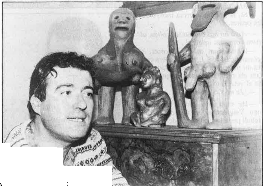
«Jo sóc "piquito de oro" o llengua d'estràl».