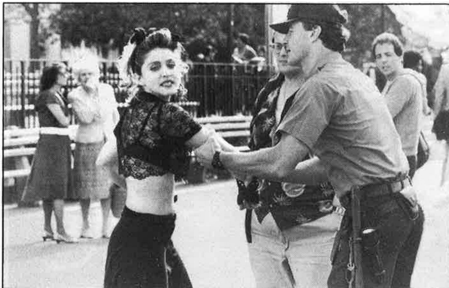
Una imatge del film «Buscant Susan desesperadament».

« Dress you up » era la cançó que obria el show. Però, equina és la teua cançó preferida? « Dress you up »