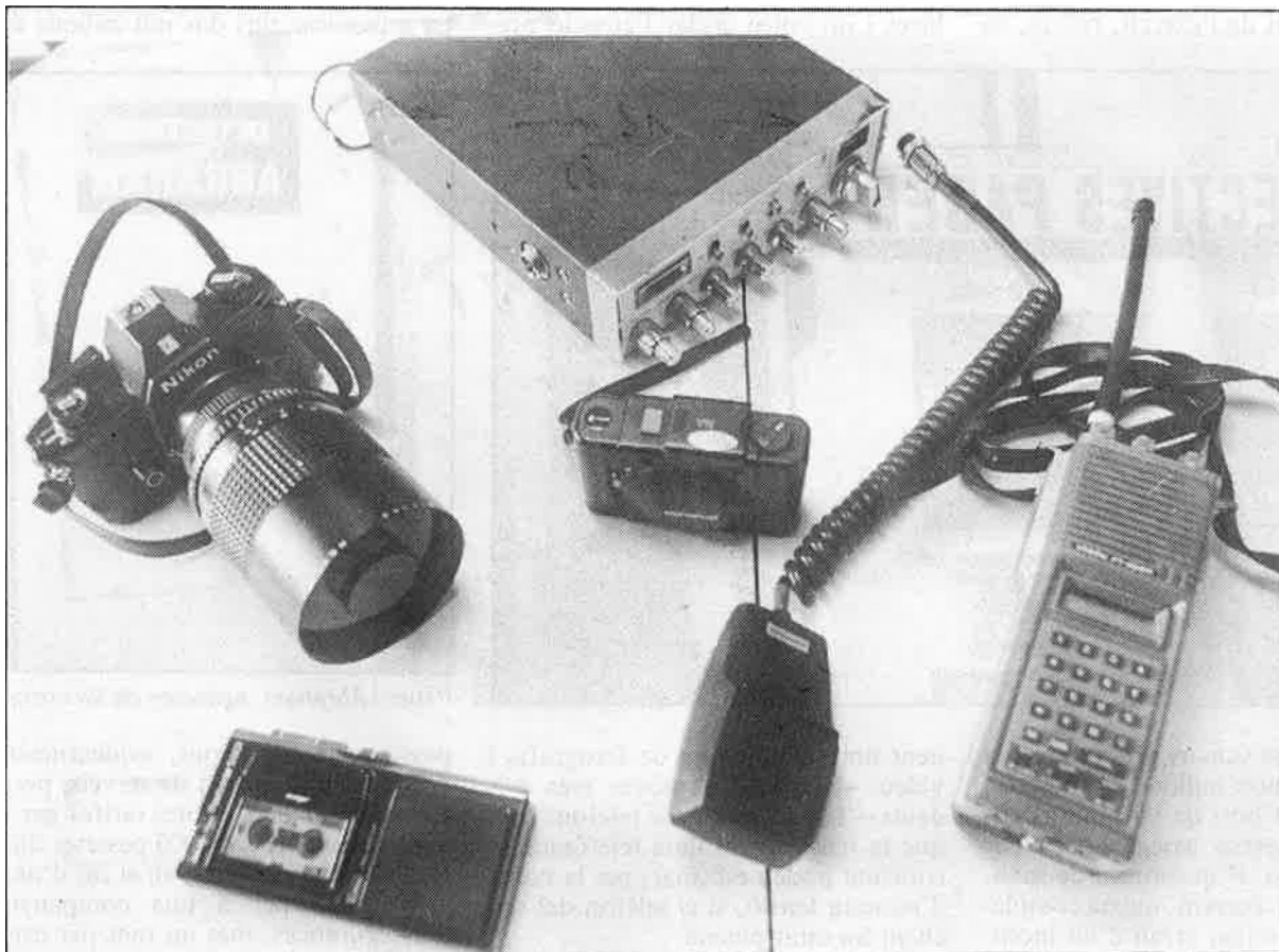
Un arsenal d'aparells sofisticats.

I no sols això, sinó que també —tot i estar rigorosament prohibit— s'infiltra en els moviments independentistes, en partits i grups polítics sobre els quals algú ha demanat informació... Per exemple, el grup ultranazi