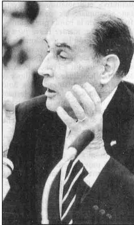
«Faré baixar els comunistes al 10 per cent».

La posició de l'actual president, fort en el seu mandat fins a finals de maig del 87, és que constitucionalment se li reconeix el màxim poder i que serà, per tant, ell, i no els partits guanyadors, qui nomeni un primer ministre. Sens dubte, aquesta posició mitterrandista va orientada a la creació d'un centre-esquerra, que normalitzi més enllà del crispat bipartidisme la vida política francesa. Per assolir això, que ja s'ha qualificat com a democràcia corrent, Mitterrand ha de comptar amb més del 30 per cent de vots per al PSF, cosa que sembla probable, i amb un PCF ben reduït, potser el 7 per cent, com diuen alguns sondeigs. Així, l'home que fou denigrat per la dreta a causa de la seva aliança governamental durant dos anys amb el PCF hauria aconseguit el «miracle» de fer passar els comunistes del 21 per cent de vots el 1980 al 7 o 8