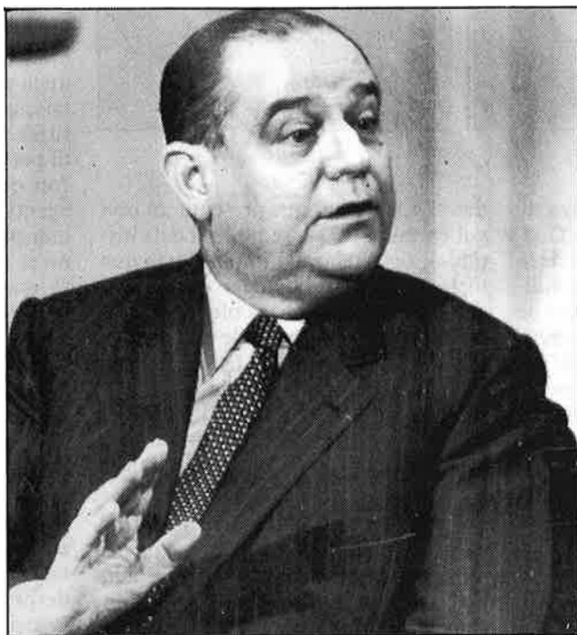
A l'esquerra, Raymond Barre, «cap quadrat en un cos rodó». Baix, Le Pen , «el fenomen de la por», el paper del qual sembla descartat en aquestes eleccions.

A la fi d'any, els sondeigs no eren menys implacables. La dreta anava cap a una clara majoria absoluta de 310 diputats dels 555 elegibles, amb una separació de més del 10 per cent sobre l'esquerra. Al febrer, però, el canvi de les previsions de vot és substancial. La dreta, coalició de la gaullista RPR (Agrupació per a la República) i el centre-dreta liberal UDF (Unió dels Demòcrates Francesos), més les desenes de franc tiradors partidaris de Raymond Barre, ja només obtindria de sis a vuit punts percentuals d'avantatge sobre l'esquerra. Sempre sense comptar, en aquests càlculs, el només 5 o 6 per cent que es