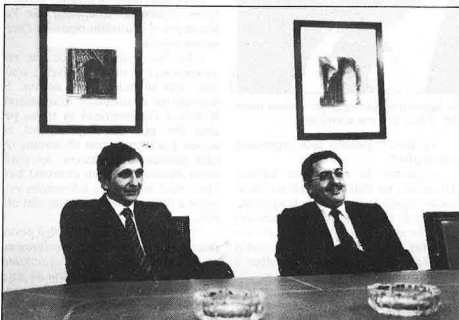
«Cal que la figura de l'empresari siga acceptada, mimada».

—És difícil fer distincions per sectors. Caldria un estudi molt detingut. Ara, hem de tenir en compte que les empreses valencianes són clàssiques, manufactureres, del sector de béns de consum. Aquests sectors l'han sentida dèbilment. Algunes passen per moments difícils, però, en general, no hi ha tanta crisi com es pot pensar, si mirem uns altres sectors com ara la gran