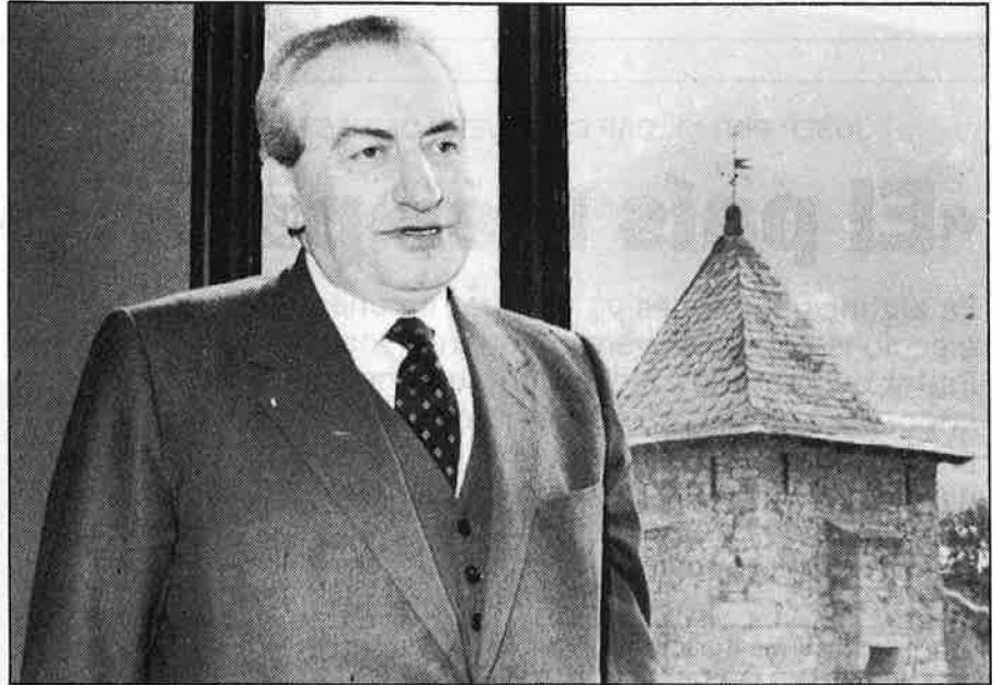
«El color polític no és la preocupació dels administradors polítics d'aquesta terra.»

que justificaria canviar aquest sistema.