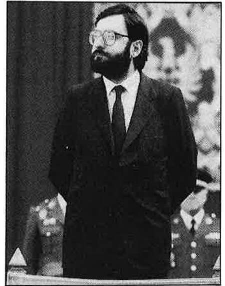
Ve/s militants del PSOE pel no. Narcís Serra ha arribat a afirmar que el no era «tornar al gasogen».