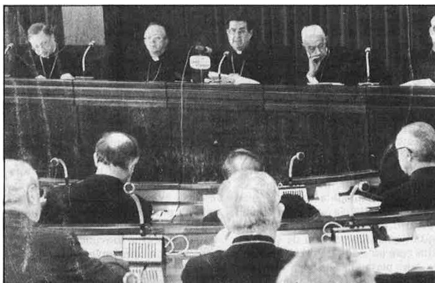
L'església sorprengué amb el seu document.

La polèmica traspasa les fronteres i tant els atlantistes com els pacifistes mobilitzaren dotzenes de personalitats estrangeres a favor de les posicions respectives. Ves per on, al capdavant els més discrets foren els americans, i els més clars a favor d'un Estat espanyol dins l'Aliança, els alemanys. No es pot perdre de vista el primer ministre holandès, que, des de Lisboa, demanà clar i castellà un sí dels espanyols a l'OTAN.