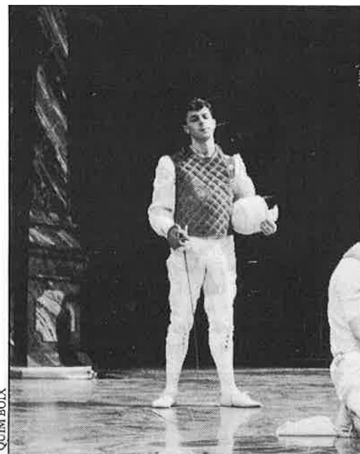
Escenes d'«El despertar de la primavera». Les eternes preguntes de l'individu davant la vida i la mort. Sense concessions.

veuen, esmaperdudes, com penetra el misteri, s'inflama i mor descobrint el secret.