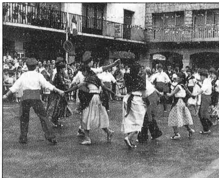
No tot a Andorra és l'esport de la neu.