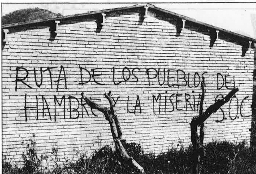
A la dreta, marxa del sindicat CCOO en protesta per les mesures agràries del PSOE. Dalt, jornal·lers d'El Burgo (Màlaga), en una assemblea. Baix, pintada durant la «Ruta de los Pueblos», del SOC.