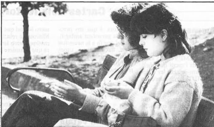
¿Hi ha un llenguatge literari de dones?

Entre les autores estudiades en el cicle cal destacar la importància de Sor Isabel de Villena i Clementina Arderiu. L'una, pel Llibre anomenat Vita Christi , on va rebatre el masclisme militant de l' Espill de Jaume Roig. L'altra, perquè malgrat fer poesia femenina —segons Maria Mercè Marçal— i anar associada a Carles Riba, el seu marit, hi ha daltabaixos en la seua obra que fan pensar que era una dona preocupada per la problemàtica del seu sexe —gènere. En aquest últim cas, les teories de Marçal semblen un poc agosarades: voler trobar en Arderiu, una dona que assumeix l'estereotip de la felicitat immòbil i que es considerava —segons l'obra— part de la