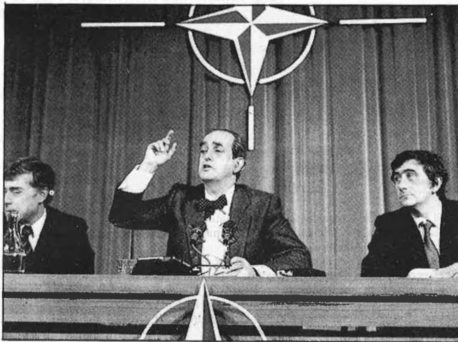
Les tensions de González i Morán per l'OTAN eren evidents.

A instàncies de la Minoria Catalana, el 27 de desembre de 1985 el Congrés de Diputats aprovà la permanència d'Espanya a l'OTAN, amb els vots contraris de minories com ERC, EE o el PCE. Els socialistes rectificaven així oficialment i públicament la seva votació de novembre de