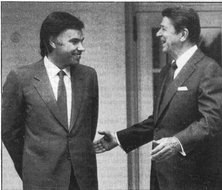
Dalt, campanya «De entrada, no», una ambigüitat calculada que donà un magnífic resultat al PSOE. A l'esquerra, Calvo Sotelo, a la primavera del 81 anuncià l'entrada a l'OTAN. Baix, Felipe González amb el president nord-americà Ronald Reagan.

S'ha dit molt que el dia que Felipe González guanyà les eleccions generals ja havia canviat de parer i que en reunions a porta tancada havia plantejat la conveniència de «renegociar» simplement l'ingrés a l'OTAN, amb l'amenaça del referèndum per obtenir altres avantatges, espe-