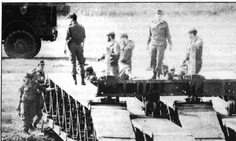
A l'esquerra, entrada a les instal·lacions de l'Estartit. Baix, Ràdio Liberty. A la dreta, la creació d'un gran campament a Sant Climent podria afectar molt les Alberes.

2.— El reforçament dels Pirineus com a barrera militar, en el supòsit de l'anomenat « Escenari A » d'un hipotètic conflicte amb el Pacte de Varsòvia (conflicte al centre