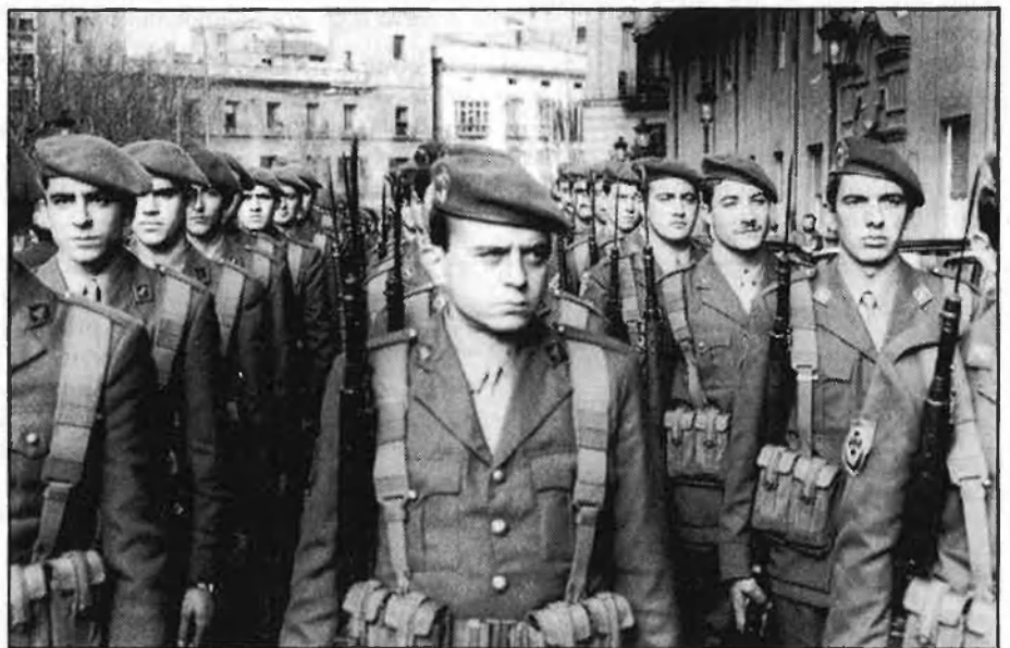
La reinstal·lació de tropes ha provocat fortes tensions al Principat.

3.— Altres qüestions polèmiques. En aquesta breu repassada a diversos aspectes referits a l'exèrcit espanyol, no podia faltar almenys una referència a un altre projecte polèmic: la instal·lació de l'Acadèmia Militar Femenina a Tortosa (capital de la comarca del Baix Ebre), que ha provocat diverses mobilitzacions d'organitzacions pacifistes i feministes contra la incorporació de la dona a la xarxa de la societat militar. Un altre punt conflictiu, des del punt de vista de l'oposició de la població civil, ha estat la presència d'importants quantitats d'enginys explosius en centres urbans o en les seves proximitats: com és el cas del polvorí militar a Montcada (el Vallès Occidental), el més important de Catalunya; o de zones de pràctiques militars en semblants condicions, com ara el camp de tir de Gavà (al Baix Llobregat).