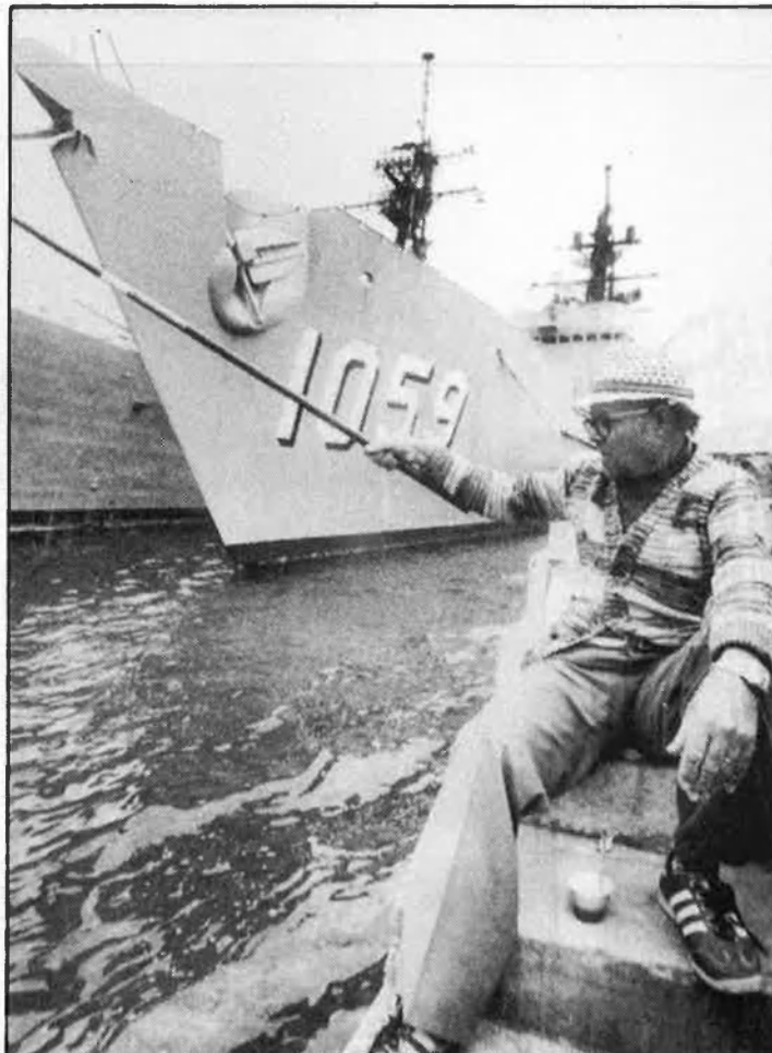
La presència de vaixells EUA al port ja s'ha fet habitual a Mallorca.

L'antena està situada a la part més alta del Puig Major, en el centre d'una edificació de planta circular d'uns cinquanta-cinc peus d'altura. La sòlida construcció està preparada per aguantar vents que arribin a dos-cents quilòmetres per hora. El cost de les obres va ésser de vint milions de dòlars de l'any 1957.