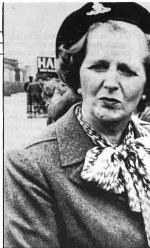
Dalt, Margaret Thatcher. A l'esquerra, Michael Heseltine, un altre fugitiu del seu govern.

conservador. De primer, fou la dimissió del ministre de Defensa, Michael Heseltine, després, la filtració d'una carta que el perjudicava i que va fer dimitir un altre ministre, el d'Indústria i Comerç, Leon Brittan, un dels homes més fidels a la cap de govern.