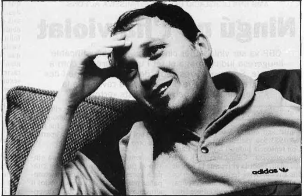
«Políticament, viatjar m'ha obert els ulls.»