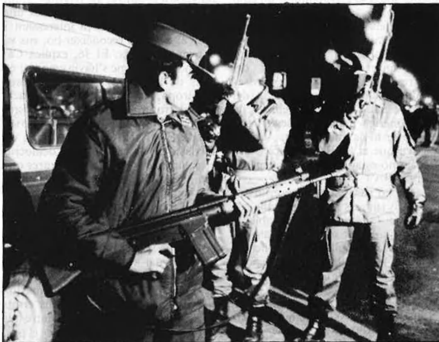
Dalt, forces de la policia militar davant l'entrada del Congrés, la matinada del 24.

D e fet, l'esdeveniment no va ocórrer el 23, sinó tres dies abans, divendres 20 de febrer del 1981, al restaurant Luigi's de la capital britànica. Ens hi trobàvem dinant un grup d'anglesos i de no-anglesos, entre aquests darrers, els senyors Camacho i Aliaga. Aquell dia Marcelino parlava pels colzes. Era l'estrella del dinar, i podia expressar-se en espanyol perquè els tres importants britànics del grup en-