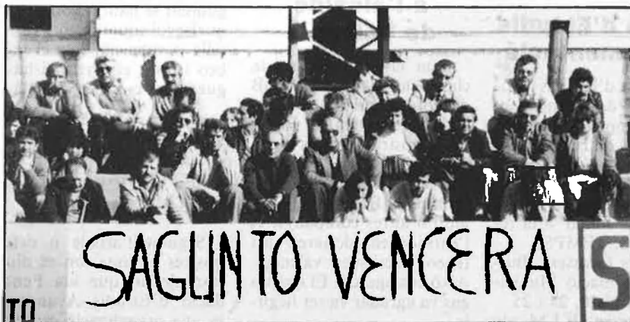
Les xifres de recol·locació d'excedents comencen a no quadrar.

El motiu immediat que ha provocat l'inici de noves accions de protesta en el poble que va constituir el mite i la referència de les lluites contra la reconversió industrial es troba en el previsible incompliment del sistema d'incorporació dels treballadors al Fons de Promoció d'Ocupació —FPO—.