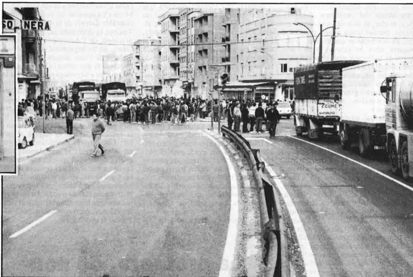
A l'esquerra, escepticisme generalitzat a Sagunt. A la dreta, una antiga mobilització.