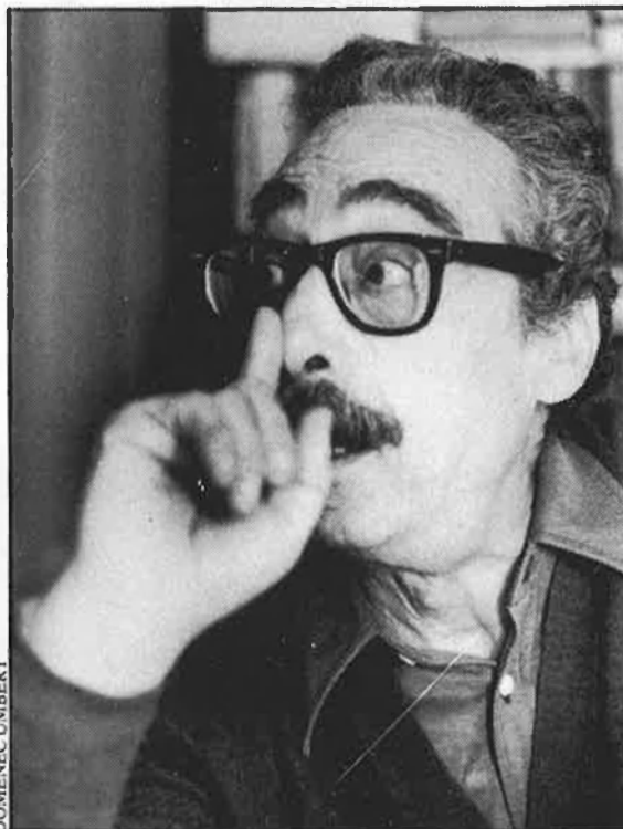
«La dona normal és la que és calenta.»

—S'ha de fer exercici, però no m'interessa fer-lo el cap de setmana