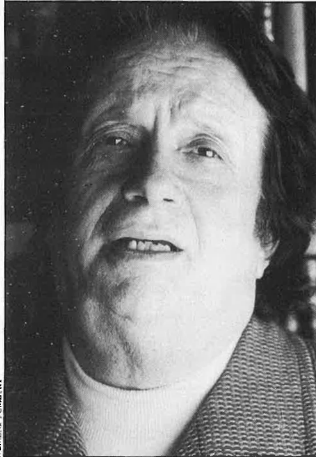
«Tot el que pugui contribuir a la independència de Catalunya és positiu.»

ques, perquè aquests són més o menys demòcrates, li passarà el mateix.