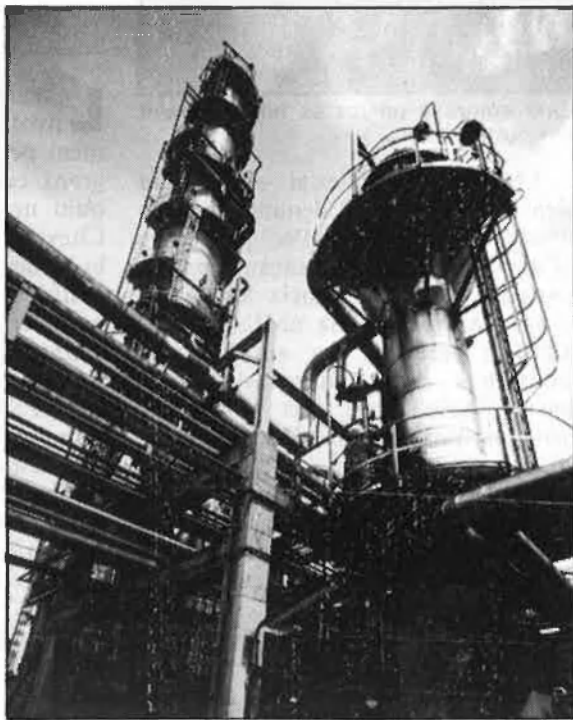
Instal·lacions petrolíferes a Castelló.