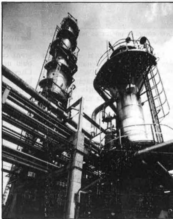
Instal·lacions petrolíferes a Castelló.