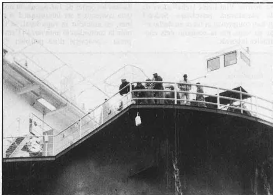
Els tancats han d'aconseguir el menjar de l'exterior.

Amb 8.500 metres quadrats i una alçada màxima de 90 metres per sobre el nivell del mar, la plataforma és una