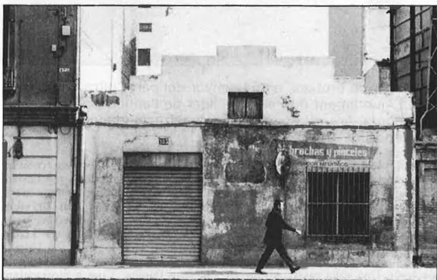
Antiga fàbrica de brotxes de Lizondo al carrer de Sant Vicent.