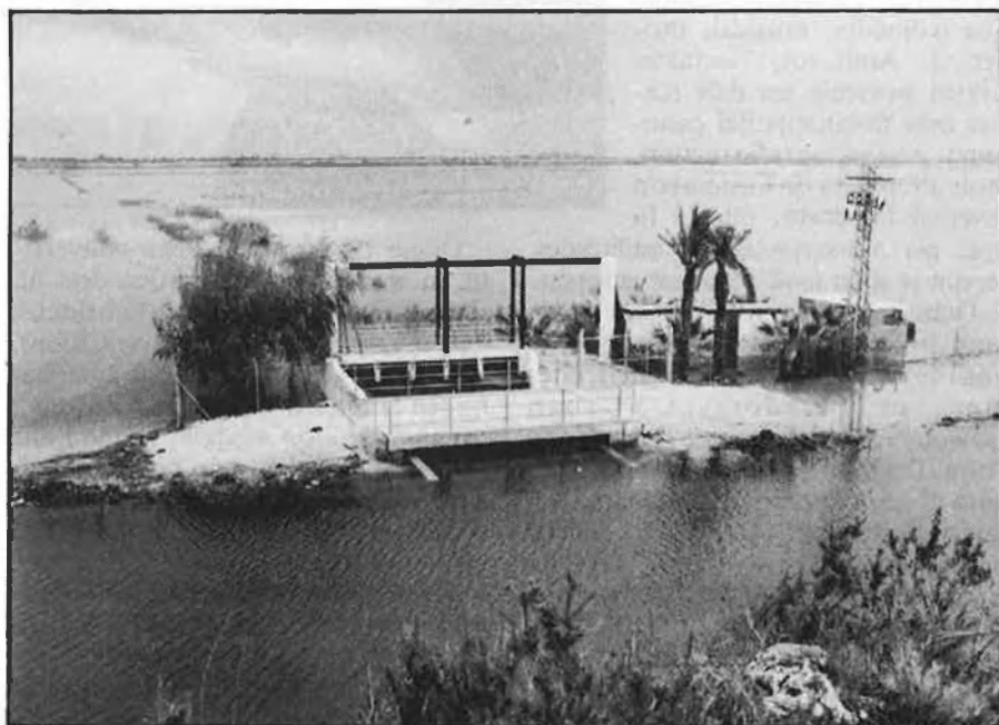
Vistes general i parcial de la marjal de Pego-Oliva.

Feia set anys que l'últim ajuntament franquista havia decidit donar llum verda a un projecte que l'IRYDA (Instituto para la Reforma y el Desarrollo Agrarios) estava promouent des de feia deu anys. El projecte consistia en la dessecació de més de