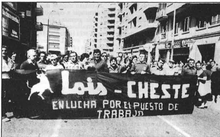
La marca i el bou: ineludiblement.

sociació de la Premsa de Madrid, objecte de la reclamació. Encara més, Sáez Merino, SA, ni tan sols ha reproduït ni reproduceix parcialment aquesta obra».