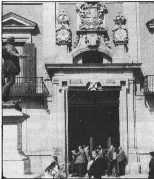
Dalt, Juan Barranco. Baix, la porta de l'Ajuntament de Madrid.

Els ajuntaments serviren també per a col·locar gent a vegades de difícil ubicació política. Aquest fou el cas d'Enrique Tierno, un home incòmode per al seu partit, però que finalment s'identificà amb el càrrec d'alcalde de Madrid, càrrec que el PSOE li pro-