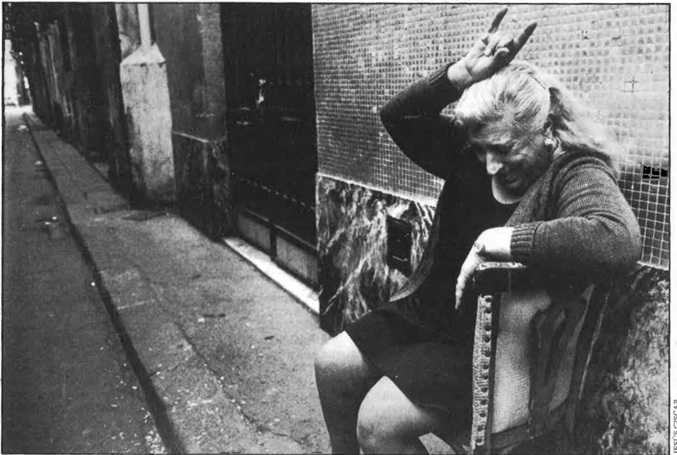
ACUSACIONS DE «COMPETÈNCIA DESLLEIAL» AL XINO