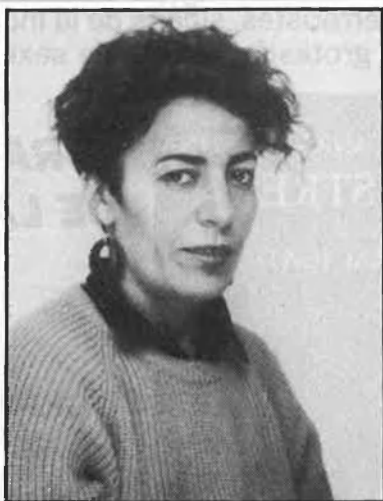
*Mestra i feminista. Treballa al Centre Assessor de la Dona, de València.

Per això, a les dones, si no se'ns dóna una professió, se'ns educa per a la prostitució. Si es vol acabar amb tota mena de prostitució, cal seguir una política d'educació i ocupació per a la dona que ens prepare professionalment per a poder ocupar un lloc com a subjectes socials.